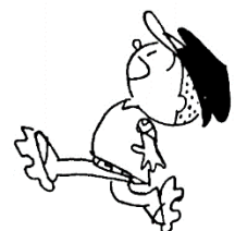
横山隆一「フクちゃん」