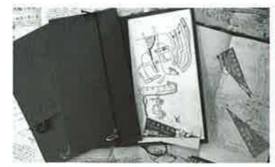
くろそん手帖 全長2mの蛇腹の白地図に利用者が自分の旅を書き込んでいく

黒尊の道は同じようなカーブが何度も連続しており、初めて訪れる人には場所の特定が難しい。地域の人なら「〇〇ちゃん宅の前」などと表現してしまふのだが、地域外の人だとそうはいかない。そこで目を