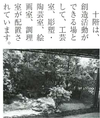
十階は、創造活動ができる場として、工芸室、彫塑室、陶芸室、絵画室、調理室が配置されています。

九階には会議等に便利な大小四つの学習室と、多目的な用途に利用できる和室、路地のある茶庭や水屋を備えた本格的な茶室があります。落ち着いた趣のある和室や茶室に、初めて来館した方から、「かるぼーとの中に、こんな場所があるの!？」という驚きの声も聞かれます。