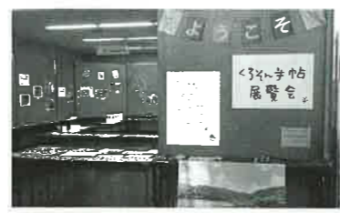
くろそん手帖展示会の様子。優秀作品には黒尊の三極で滲いた和紙の賞状が贈られる

工夫したもの、ポケットをつけたもの、出来事を絵日記のように描いたもの、裏の余白を使ったもの、出会った生き物を記載したもの、それぞれの旅や興味がどれほど多様であったかがよく分かる。