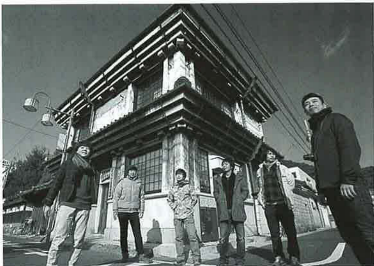
まちかどギャラリーの前に集う「アーティスト・イン・レジデンス須崎」参加作家たち

高知県立美術館企画監兼学芸課長。一九八一年から福岡県立美術館に勤務、同館学芸課長を経て、二〇一一年から現職。日本の戦後から現代の美術を専門にし、現代美術展を多数企画。地域社会における美術館の役割に関心を持ち、美術館教育やアートマネジメントにも力をいれている。