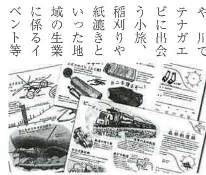
手帖とセットで使う資料。A4サイズ。3つ折りにするとくろそん手帖に挟むことができる

使われた手帖を年に一度持ち主に出品を呼びかけて集め、手帖の展示会を開催している。展示会にはほんとうに様々なくろそん手帖が帰ってくる。表紙飾りにこだわったもの、ゴム止めの付け方を