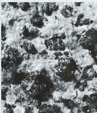
片麻岩中のガーネットの結晶

南極授業は自校である高知小津高校で二回、後は東京の科学館や北海道の動物園と結んで行われた。この児童生徒も熱心に質問をしてくれ、南極に興味関心があることがわかったし、逆に日頃の生活とは関係ない南極に改めて関心を持ち、地球が小さくなった子もいた。一度南極に出かけたからといって何がわかったわけではないが、今回の小さな体験から南極の天気の変化、岩石の風化によってできるバランス彫刻のような迷子石、岩石の表面や隙間に生えるカラフルな地衣類や苔の話、氷河の流れの様子や氷河の末端で生まれる氷山のこと、海水の夏の姿等々、見て気づいた些細なことをお話できると幸せだ。