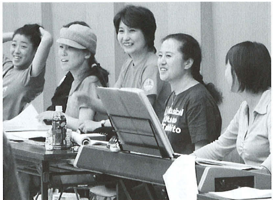
右から二人目が筆者

舞台の幕が開き、観客の拍手の中で物語を終えた時の喜びと達成感、そして一体感は、舞台に立った者