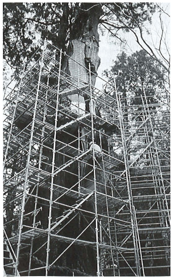
「杉の大スギ」台風被害の修復治療

私が樹木医になってから早いもので二十年が経ちました。大学を出て、鹿児島県を振り出しに、宮崎県、東京都、インドネシア、そして富山県と十一年間を中越パルプ工業(株)で、いわゆる紙の原料である「樹を伐る」業務に携わったのち、郷里高知にUターンしてからは、造園緑化の業界で「樹を植えて育てる」喜びを知り、今は「樹を護る」意義を感じながら樹木医としての残りの人生を歩んでいます。