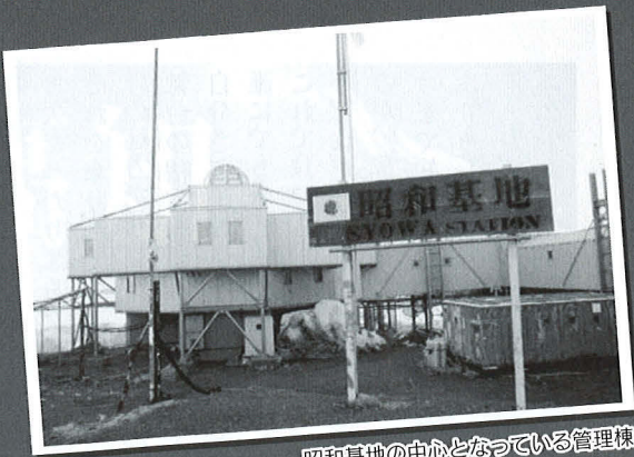
昭和基地の中心となっている管理棟