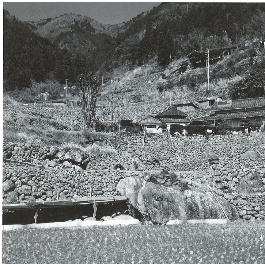
棚田の全部が石積みである。よく石を集めたものだと思ふ。

熱狂的な映画ファンではないが、ふらっと町の映画館に足を運ぶことがある。学生頃は、ハリウッド映画が好きだったが、年を重ねるごとに、「娯楽」というより監督のメッセージ性の高い作品が好きになってきた。