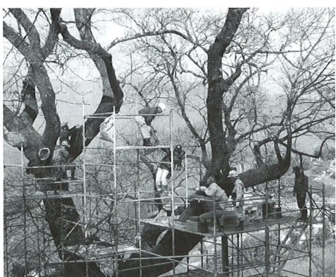
「ひょうたん桜」の樹幹腐朽治療 ボランティア団体「緑サポーター」の有志とともに

ない、又はそれに負けない体質を持っていることなどが不可欠です。(このことは人間も全く同じだといえますが...) そのような樹木を健全に育て護ろうというのが樹のお医者さんの仕事であり、それによってひとにやさしい環境づくりに寄与しようという理念をもって活動するのが樹木医であると考えています。