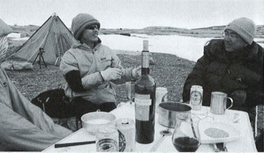
スカールン氷河を見ながら、見かけはリッチな野外食

ある野外ブリス+テントで一泊することになった。まだ時間も早かったので外で食事としゃれ込んだ。この絶景を前に食事とは、南極ならではの楽しみである。料理の得意な研究者が、ワインナーを調理して、アツアツを皿に入れてくれる。自前の酒も。これ以上の贅沢があるのかという気がして、思わずホーッとためいきがでる。しかし、次の瞬間ワインナーをもうひとつかじりして……。先ほど焼きただったとは思えないほど冷たくなっていたのだ。ビールもワインも冷蔵庫いらずなのはいいが、冷めた食事はやっぱり遠慮したい。特に寒冷地で体力を消耗しやすいので、