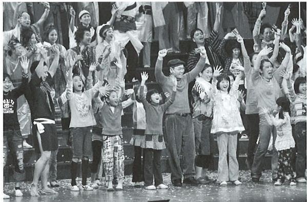
2008年のミュージカルより よさこいのシーン

緒に遊ぶといつても、同じ空間でそれぞれが別のゲームに夢中になっていたりする。だから今、市民ミュージカルが必要とされているのかも始まらないから。否応なく関わらざるを得ないから。本当は、コミュニケーションを求めているから。関わることが必要だつて、気が付いているから。そうだとしたら、少し未来は明るい気がする。