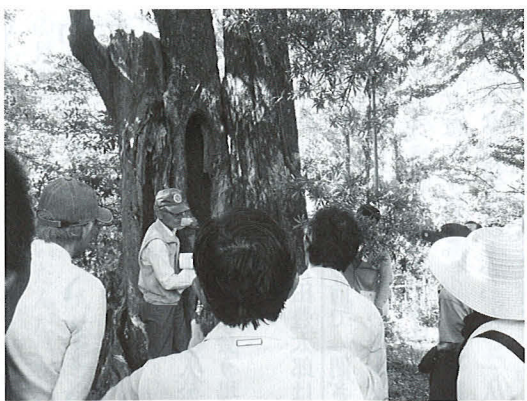
高知城の樹木診断(市民対象の樹木医セミナー)

かと思われれます。それぞれの樹木医の経歴を見ると、造園関係が最も多く六〇%ほどを占めています。農林業、薬剤・資材業、研究職、教職、公務員、中には写真家、NHKアナウンサーなどと実に多様な職種を経て、又は現職でこの道にかかわるようになっていくことが窺われます。また、こうした異業種の仲間の交流の中で互いに知識・技術を提供・吸収し合い、当初の目的に向かって各々が研鑽を積んでいるわけです。