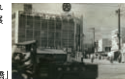
「かつての高知大丸と使者屋橋」

明治から平成にかけて撮影された高知市中心部の古写真を展示します。(生まれたまちブース)