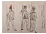
「黒船来航絵巻」に描かれたアメリカ兵

*8:00~19:00(入館は18:30まで) *会場/2階ふれあいホール *要入館料(一般300円) *申込不要