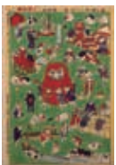
「しん板ねこの世界」