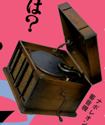
音響機器 (レプリカ)