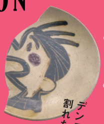
デンスケの割れた皿