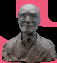
久米正雄像 隆一作