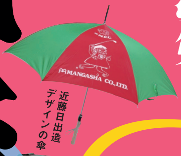
近藤日出造 デザインの傘