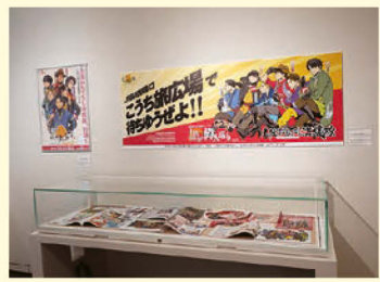
土佐おもてなし海援隊