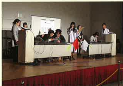
1コマのセリフを巡り大バトル!