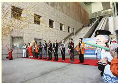
華々しく迎えたオープニング