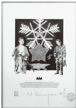
「新選組」黒鉄ヒロシ