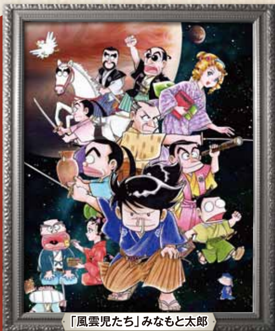
「風雲児たち」みなもと太郎