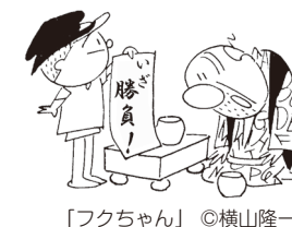
「フクちゃん」 ©横山隆一